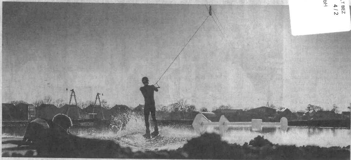
Und ab geht's in die Abendsonne – seit Kurzem ziehen die Wassersportler im Wakepark Fehmarn ihre Kreise.

...mpetenzteam ...irs Dach ...ÄCHER-VON ...HAYE ...LDENBURG