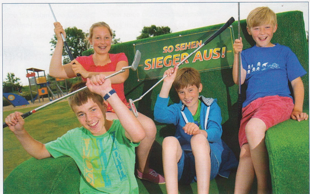
Eine Spielart zwischen Minigolf und Golf bietet der Adventure-Golfplatz in Meeschendorf. Hier wurde ein privates Projekt mit Hilfe der AktivRegion verwirklicht.