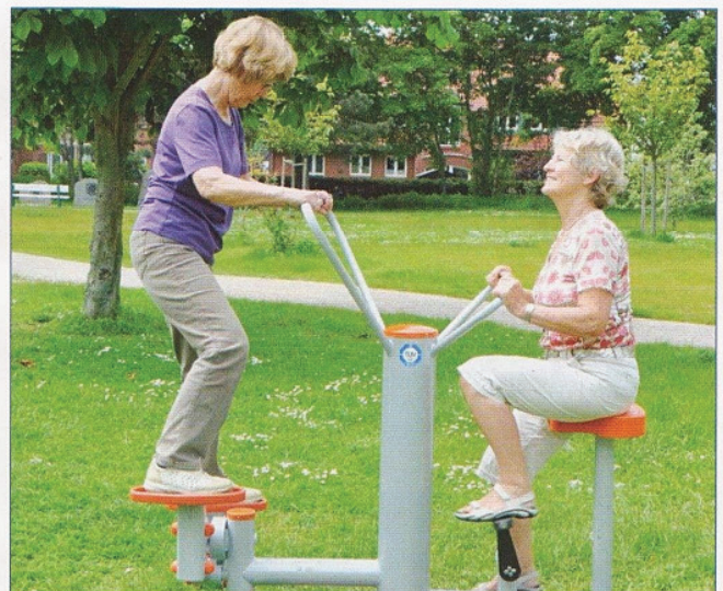
Die Idee, Einheimische und Gäste aller Altersstufen zu mehr Bewegung im Freien zu motivieren, war die Grundlage für die Schaffung von Mehrgenerationen- und Bewegungsplätzen in Ostholstein. Sie erhalten die Gesundheit, fördern neue soziale Kontakte sowie den Austausch zwischen den Generationen.