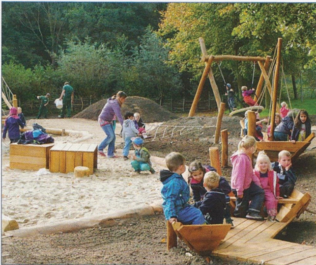
Hervorragend angenommen wird der landesweit erste inklusive Spielplatz auf dem Gelände des Wallmuseums in Oldenburg, auf dem Kinder mit und ohne Handicap gemeinsam spielen können. Das Museum plant mit Blick auf das generationsübergreifende Erleben, Schritt für Schritt sein gesamtes Angebot barrierefrei zu gestalten.